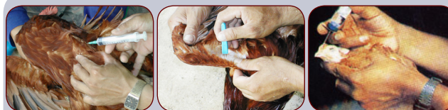
การฉีดกล้ามเนื้อ