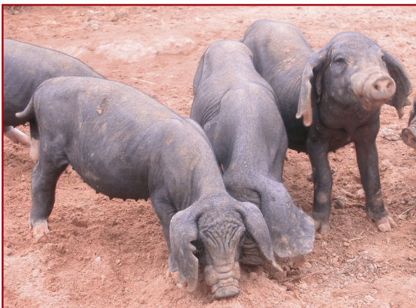
สถานีวิจัยทดสอบพันธุ์สัตว์สกนนคร 194 หมู่ 6 ตำบลพังขว้าง อำเภอเมือง จังหวัดสกนนคร 47000 ผู้ 3 ตัว เมีย 4 ตัว