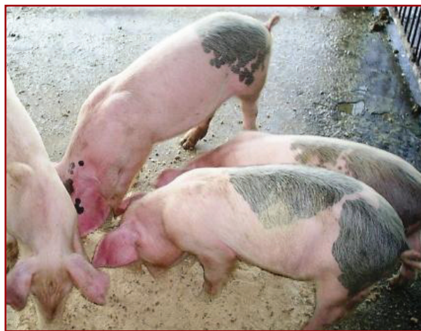
ลูกสุกรภูพาน 2 อายุ 2 เดือน มีสีขาว จุดสีดำที่หลัง เลี้ยงง่ายและโตเร็ว

สุกรพันธุ์ภูพาน 1 เกิดจากการผสมข้ามพันธุ์ระหว่างสุกรพันธุ์หมอยาน พันธุ์พื้นเมืองสกลนคร (หมูก๊) และพันธุ์ดুর็อค สุกรภูพาน 1 มีสายเลือดสุกรหมอยาน 18.75 เปอร์เซ็นต์ พื้นเมือง 18.75 เปอร์เซ็นต์ และดুর็อค 62.5 เปอร์เซ็นต์ มีลักษณะลำตัวสีดำหรือน้ำตาลแดง ขนาดกระทัดรัด หลังโค้งเล็กน้อย หูปรก หน้าสั้น คอสั้น เลี้ยงง่าย ทนต่อสภาพแวดล้อมได้ดี หากินเก่ง ลักษณะทางเศรษฐกิจ ให้ลูก 14 ตัวต่อครอก น้ำหนักเมื่ออายุ 3 สัปดาห์ 6.0 กิโลกรัม โตเต็มที่เพศเมียน้ำหนัก 120 กิโลกรัม เพศผู้น้ำหนัก 150 กิโลกรัม อัตราการเจริญเติบโต 0.456 กรัมต่อวัน ใช้อาหาร 2.14 กิโลกรัม เพื่อเพิ่มน้ำหนักตัว 1 กิโลกรัม เนื้อสันใน และสันนอกดี น้ำหนักซากอ่อน 83.16 เปอร์เซ็นต์ น้ำหนักเครื่องใน 10.53 เปอร์เซ็นต์ เนื้อแดง 39.33 เปอร์เซ็นต์ ความหนาไขมันสันหลัง 1.4 นิ้ว