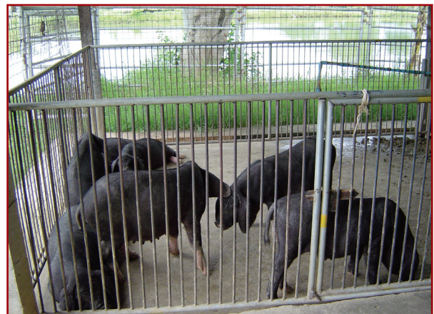
ศูนย์ศึกษาการพัฒนาภูพาน อันเนื่องมาจากพระราชดำริ บ้านนาบกเค้า ตำบลห้วยยาง อำเภอเมือง จังหวัดสกนนคร 47000 ผู้ 1 ตัว เมีย 2 ตัว