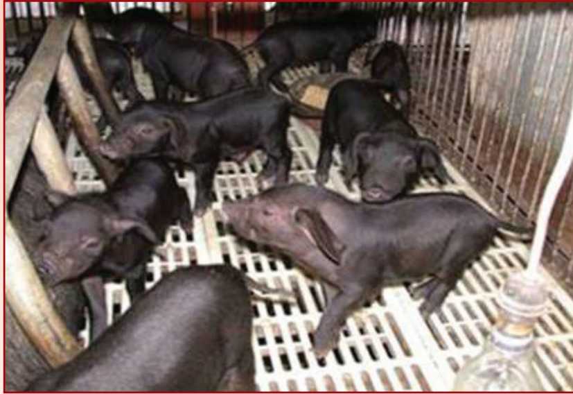
ลักษณะลูกสุกรลูกผสมหมอยาน-ดอร์ค พระราชทานชื่อ “สุกรมิตรสัมพันธ์”