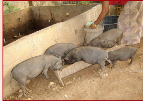
ลูกสุกรอ้วนท้วนสมบูรณ์