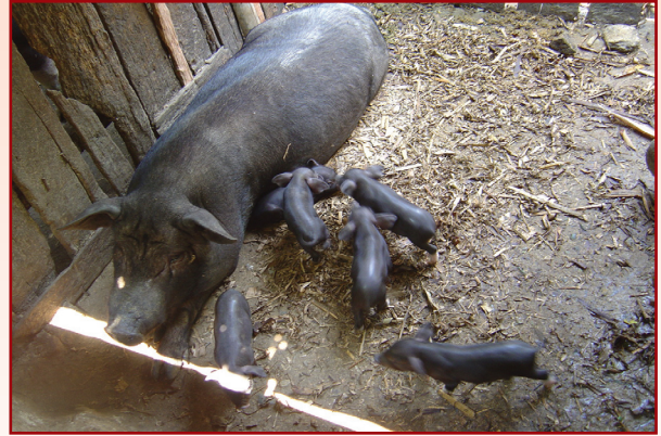
แม่สุกรคลอดลูกใหม่เกษตรกรจะเลี้ยงซังกคอกแม่ร่วมกับลูก จนถึงหย่านมจึงแยกขาย

อาหาร ใช้หยวกกล้วย ใบบอน ใบเผือก ต้มผสมกับรำ เศษอาหาร ให้วันละ 2 ครั้ง เช้า-เย็น ตัวละประมาณ 1 ลิตร ให้ตลอดทั้งปี ลูกสุกรให้ข้าวผสมมะละกอให้กิน ที่ฟาร์มสาธิตของโครงการหลวงจะมีอาหารให้สุกรประมาณ 3 เดือน หลังจากนั้นก็ให้หยวกกล้วย รำ เศษอาหาร เศษผัก เหมือนกับสุกรที่เลี้ยงทั่วไป