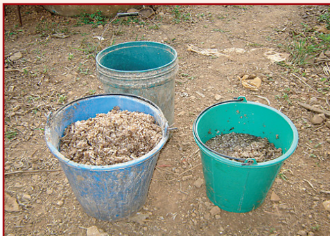
อาหารหลักหยวกกล้วยแห้งผสมกับรำหยาบ