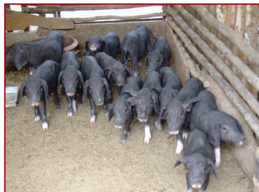
สุกรลูกผสมพันธุ์หมอยาน 50 เปอร์เซ็นต์ ลูกครอกเดียวกัน แรกคลอดมี 16 ตัว ตาย 2 เหลือ 14 ตัว