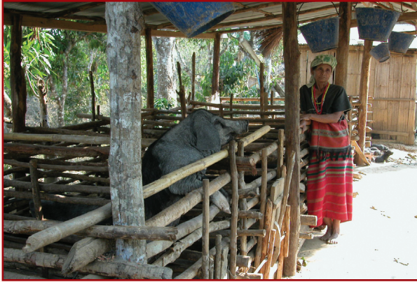
คอกสร้างจากวัสดุที่หาได้ เช่น ไม้ไผ่ ไม้เล็ก หลังคาสังกะสี

วิธีการเลี้ยง เลี้ยงผลิตลูกและเลี้ยงไว้ขาย เช่น ลูกสุกรมี 10 ตัว จะเก็บไว้ 1-2 ตัว นอกนั้นขายที่บ้านแม่จรเลี้ยงสุกรเพื่อขุนไว้กิน ส่วนใหญ่เลี้ยงลูกซังกกับแม่ โดยไม่ได้ดูแลเป็นพิเศษจนกว่าจะกินอาหารหย่านมจึงแยกขาย ส่วนตัวที่จะเก็บไว้เป็นแม่พันธุ์ก็จะแยกซังไว้ต่างหาก