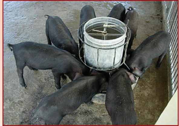
สุกรพันธุ์ภูพาน 1 หลังหย่านมเลี้ยงง่าย

สุกรพันธุ์ภูพาน 1 เกิดจากการผสมข้ามพันธุ์ระหว่างสุกรพันธุ์หมอยาน พันธุ์พื้นเมืองสกลนคร (หมูก๊) และพันธุ์ดুর็อค สุกรภูพาน 1 มีสายเลือดสุกรหมอยาน 18.75 เปอร์เซ็นต์ พื้นเมือง 18.75 เปอร์เซ็นต์ และดুর็อค 62.5 เปอร์เซ็นต์ มีลักษณะลำตัวสีดำหรือน้ำตาลแดง ขนาดกระทัดรัด หลังโค้งเล็กน้อย หูปรก หน้าสั้น คอสั้น เลี้ยงง่าย ทนต่อสภาพแวดล้อมได้ดี หากินเก่ง ลักษณะทางเศรษฐกิจ ให้ลูก 14 ตัวต่อครอก น้ำหนักเมื่ออายุ 3 สัปดาห์ 6.0 กิโลกรัม โตเต็มที่เพศเมียน้ำหนัก 120 กิโลกรัม เพศผู้น้ำหนัก 150 กิโลกรัม อัตราการเจริญเติบโต 0.456 กรัมต่อวัน ใช้อาหาร 2.14 กิโลกรัม เพื่อเพิ่มน้ำหนักตัว 1 กิโลกรัม เนื้อสันใน และสันนอกดี น้ำหนักซากอ่อน 83.16 เปอร์เซ็นต์ น้ำหนักเครื่องใน 10.53 เปอร์เซ็นต์ เนื้อแดง 39.33 เปอร์เซ็นต์ ความหนาไขมันสันหลัง 1.4 นิ้ว