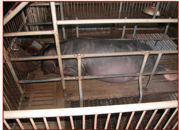
ศูนย์วิจัยและบำรุงพันธุ์สัตว์นครราชสีมา ตำบลชนงพระ อำเภอปากช่อง จังหวัดนครราชสีมา 30130 ผู้ 2 ตัว เมีย 10 ตัว