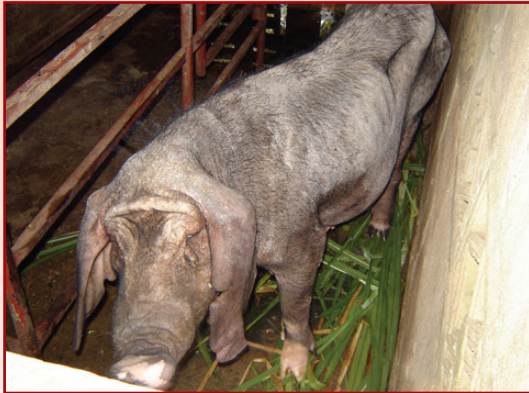
แม่พันธุ์หมอยาน จะเลี้ยงลูกไปเรื่อยๆ แม้ว่าแม่ สุกรจะร่างกายซูบผอม แต่ลูกสุกรอ้วนทุกตัว เป็น คุณสมบัติที่ดีที่สุด

กิจกรรมเลี้ยงสุกรภายใต้โครงการเกษตรเพื่ออาหารกลางวันของ ร.ร.ตชด.บ้านในวง อ.ละอุ่น จ.ระนอง เลี้ยงเพื่อผลิตลูกสุกรบริโภคและจำหน่ายให้แก่ชุมชน