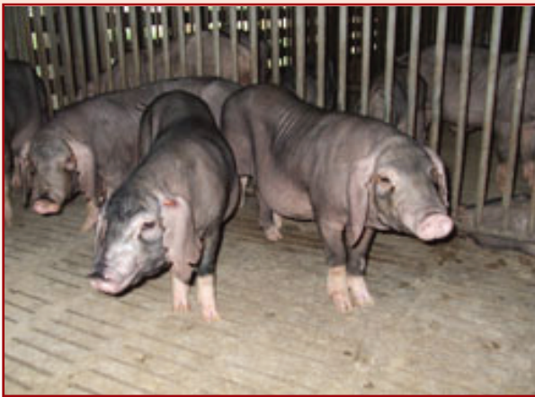
ศูนย์วิจัยและบำรุงพันธุ์สัตว์ทับทวน หมู่ 4 ตำบลทับทวน อำเภอแก่งคอย จังหวัดสระบุรี 18260 ผู้ 1 ตัว เมีย 5 ตัว

ปัจจุบันกรมปศุสัตว์ได้ทำการเลี้ยงสุกรพันธุ์หมอยานในหน่วยงาน 4 แห่ง เพื่ออนุรักษ์สายพันธุ์ และขยายพันธุ์ให้แก่เกษตรกรที่สนใจ ดังนี้