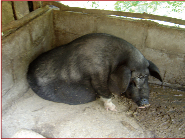
แม่พันธุ์ตั้งท้องใกล้คลอดเกษตรกรจะนำมาขังคอกเพื่อดูแล

วิธีการเลี้ยง จะเลี้ยงลูกขังร่วมกับแม่ และมีการเลี้ยงปล่อย ที่บ้านปางเกี้ยว จะแยกไว้ห่างจากตัวบ้าน โดยไม่ได้ดูแลเป็นพิเศษจนกว่าจะกินอาหาร หย่านมจึงแยกขาย หากตัวไหนต้องการเลี้ยงไว้เป็นแม่พันธุ์ ก็แยกขังไว้ บางรายจะไม่มีโรงเรือนให้สุกร ผูกล่ามไต้ต้นไม้ เช่น ลั่นจี่ มะม่วง หรือไต้ถุนบ้าน