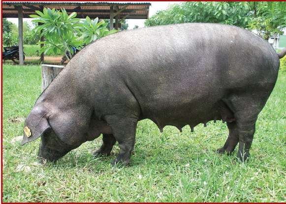
สุกรพันธุ์ภูพาน 1 แม่พันธุ์ สีดำ ขนาดกระทัดรัด