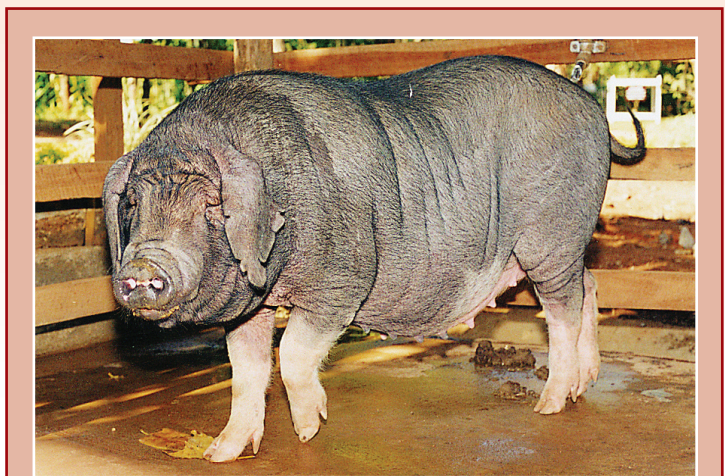
สุกรหมอยานชุดแรก สถานที่เกิดสาธารณรัฐประชาชนจีน นำเข้ามาในประเทศไทยเมื่อวันที่ 19 มิถุนายน 2524

เมื่อกรมปศุสัตว์ได้รับสุกรพันธุ์หมอยานมาเลี้ยงดู จึงได้เริ่มดำเนินการศึกษาวิจัยสุกรหมอยานในด้านต่างๆ ที่หน่วยส่งเสริมการเลี้ยงสุกร บางเขน และที่ศูนย์วิจัยและบำรุงพันธุ์สัตว์เชียงใหม่ ตั้งแต่ พ.ศ. 2524 เป็นต้นมา เพื่อเป็นข้อมูลพื้นฐานในการจัดการดูแล การใช้ประโยชน์จากพันธุกรรมที่ดีเด่น โดยเฉพาะในด้านการให้ลูกดก ตลอดจนแนวทางในการส่งเสริมสู่เกษตรกร โดยได้ทดลองนำสุกรหมอยานผสมข้ามพันธุ์กับสุกรพันธุ์แท้สายพันธุ์การค้ำแบบอุตสาหกรรม ได้แก่ พันธุ์ดুর็อค ลาร์จไวท์ และแลนด์เรซ มีผลการศึกษา ดังนี้