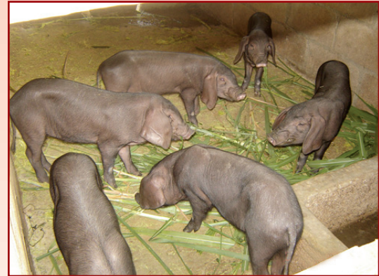
ลูกสุกรหลังจากหย่านม มีสุขภาพแข็งแรง เลี้ยงง่าย ให้อาหารปกติเหมือนให้แม่กิน