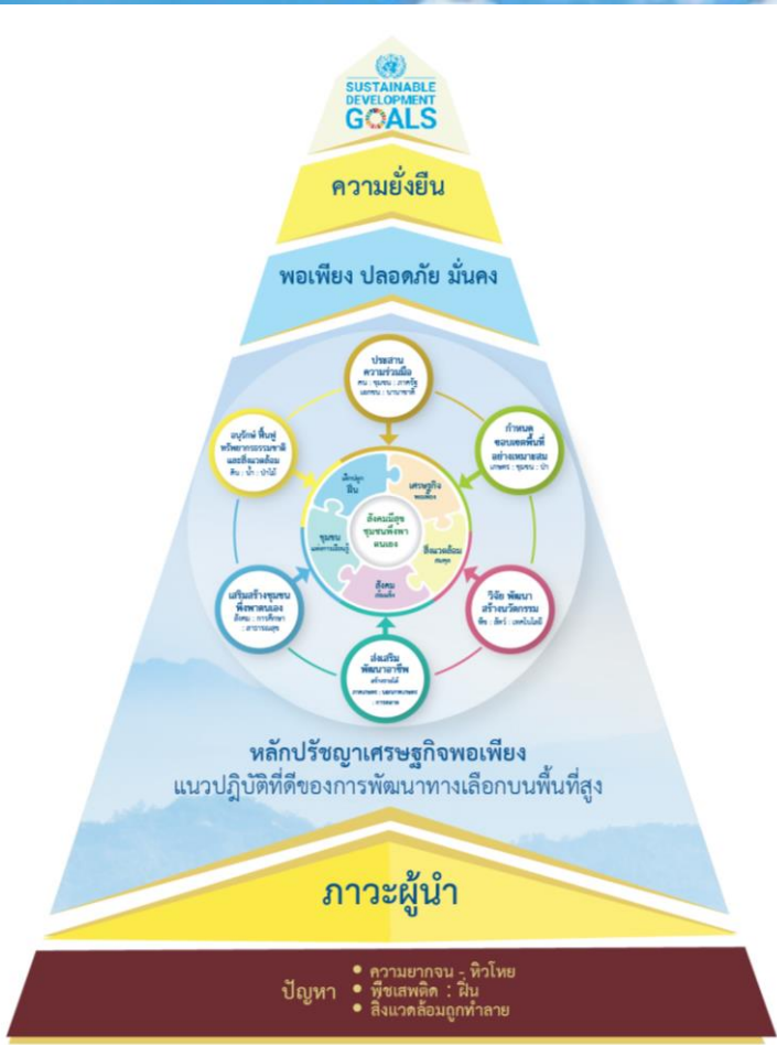
โครงการหลวงโมเดล